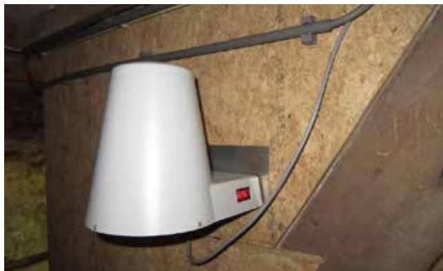
Deze Delta unit gaat het optrekkend vocht in de muren tegen.

Om het risico op verspreiding van het coronavirus te beperken, volgen wij het advies van het RIVM. Zo heeft de overheid als richtlijn bepaald dat het persoonlijk contact zoveel mogelijk vermeden moet worden. Anders dan wij van plan waren, doen wij u nu schriftelijk een voorstel voor onze aanpak en vragen wij uw akkoord. Met uw bewonerscommissie hebben wij deze aanpak telefonisch besproken. We snappen goed dat u misschien meer wilt weten. Verderop leest u hoe u uw vragen ook in deze tijd kunt stellen.