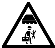
Onderhoud zonwering uitsluitend door zonweringsspecialist