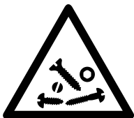
Verwijder geen onderdelen en/of bevestigingsmaterialen