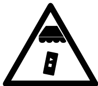
Aansturing uitsluitend door meegeleverde bedieningen