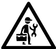
Montage zonwering uitsluitend door zonweringsspecialist

Veiligheid is prioriteit nummer één. Indien er onverantwoord met de buitenzonwering wordt omgegaan leidt dit mogelijk tot situaties die de veiligheid en levensduur van de buitenzonwering beïnvloeden. Bekijk daarom onderstaande waarschuwingen goed!