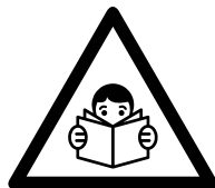
Lees voor gebruik deze handleiding goed door