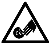
CE sticker niet verwijderen