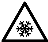
Niet openen/geopend houden bij vorst