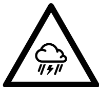
Niet openen/geopend houden bij slecht weer