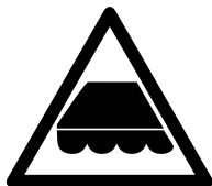
Zonwering niet onbeheerd open laten staan