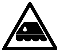
Nat doek z.s.m. open laten drogen, pas sluiten wanneer droog